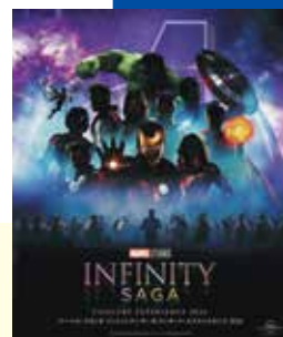
Presentation licensed by Disney Concerts © All rights reserved