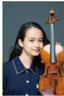
HIMARI: ©Naruyasu Nabeshima(29日)