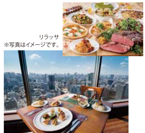
リラッサ ※写真はイメージです。