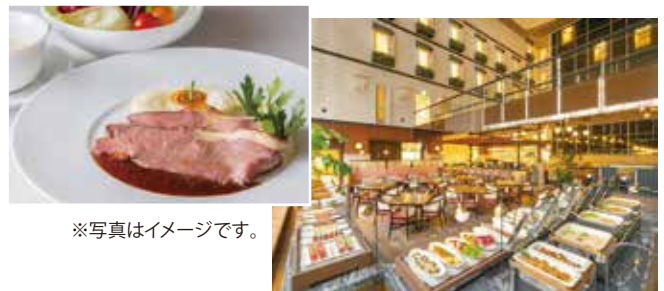
※写真はイメージです。

場 所 武蔵野市吉祥寺本町2-4-14 [JR中央線・京王井の頭線「吉祥寺駅」 北口から徒歩約8分]