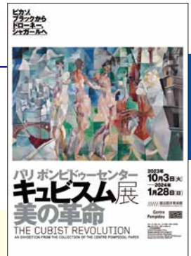
展示会ビジュアル

世界屈指の近現代美術コレクションを誇るパリのポンピドーセンターの所蔵品から、キュビズムの重要作品が多数来日し、そのうち50点以上が日本初出品です。主要作家約40人による絵画を中心に、彫刻、素描、版画、映像、資料など約140点を通して、20世紀美術の真の出発点となったキュビズムの豊かな展開とダイナミズムを紹介します。